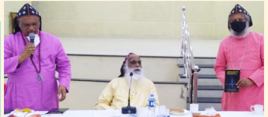
ചർച്ച് ആൻഡ് റിന്യൂ നോർമൽ - പുസ്തക പ്രകാശനം