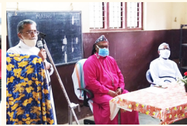
കുരുമ്പൻമുഴി മാർത്തോമ്മാ സി.ഡി.സി.