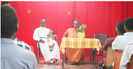
ഓണാഘോഷം - നവജീവകേന്ദ്രം, മലയാലപ്പുഴ