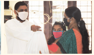
ചിൽഡ്രൻസ് ഹോം, താവളപ്പാറ