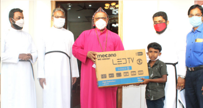
കൊക്കാത്തോട് മിഷൻ - ടി.വി.വിതരണം