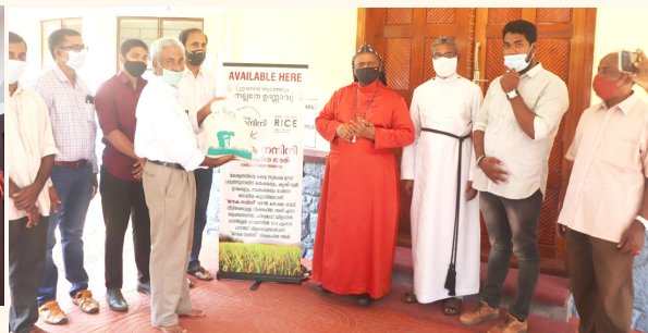
വിഷരഹിത അരി വിതരണം