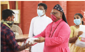
ഓണാഘോഷവും ഓണക്കിറ്റ് വിതരണവും