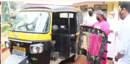
കോവിഡ് പ്രൊട്ടക്ഷൻ ഷീൽഡ് വിതരണം