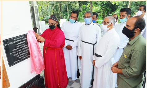
കുളമാൻകുഴി സെന്റ് ആൻഡ്രൂസ് ഇടവക പാഴ്സനേജ് കുദാശ

Manager, Bhadrasana Dhvani TMAM Mar Thoma Centre Mandiram P.O., Ranni 689 672 bhadrasanadhwani@gmail.com