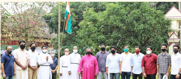
സ്വാതന്ത്ര്യദിനാഘോഷം - റാന്നി മാർത്തോമ്മാ സെന്റർ