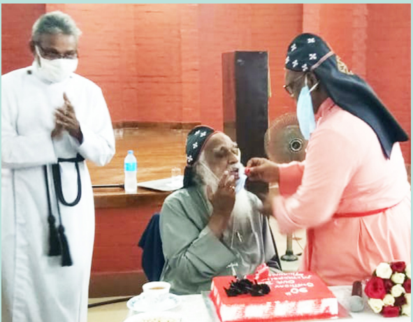
അഭിവന്ദ്യ മെത്രാപ്പോലീത്താ തിരുമേനിക്ക് നവതി ആശംസകൾ