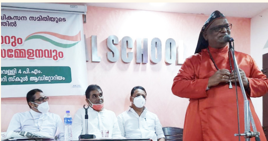
കന്നനായ സഭ സഹായ മെത്രാൻ ഗീവർഗീസ് മാർ അപ്രേമിൻ അനുമോദനം - ഉദ്ഘാടനം