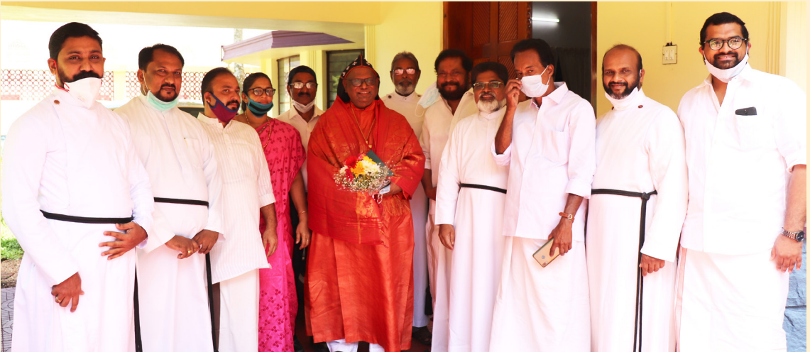
ഭദ്രാസന ഓഫീസ് ഭാരവാഹികളും കൗൺസിൽ അംഗങ്ങളും